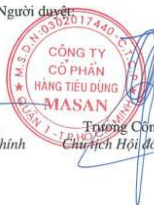
Trương Công Thăng Chủ tịch Hội đồng Quản trị